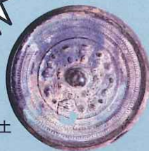
コヤダニ古墳出土 三角縁神獸鏡